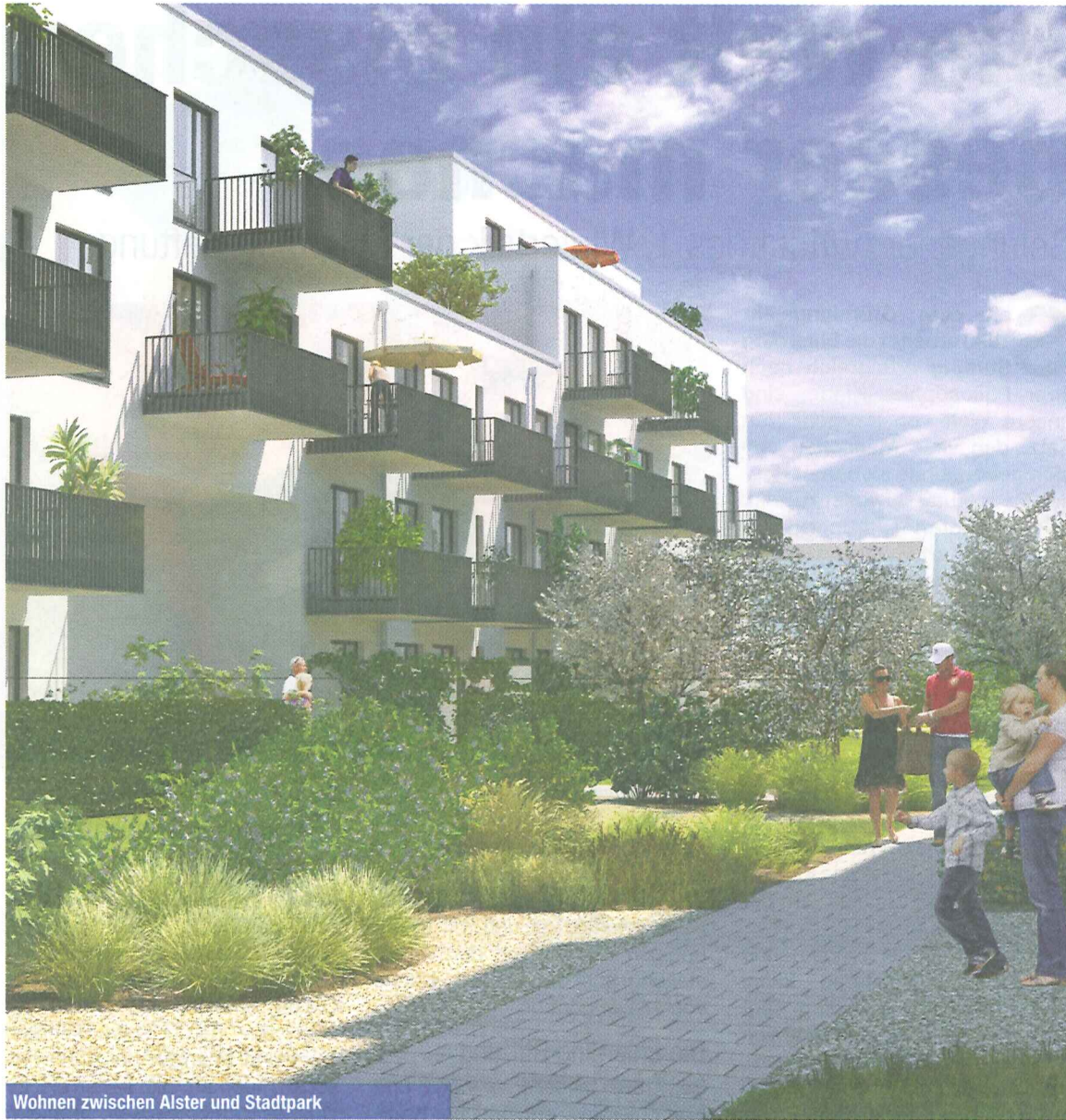
Wohnen zwischen Alster und Stadtpark

Die Leistung der Gruppe erstreckt sich nicht nur auf alle Bereiche von Neubauvorhaben, sondern auch auf die Revitalisierung, Konvertierung und Weiterentwicklung von Bestandsimmobilien und Altbauten.