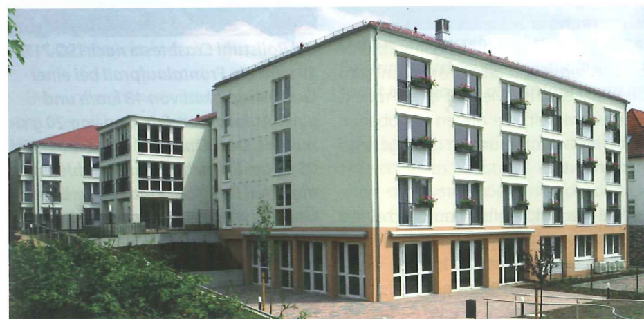
In einer Bauzeit von elf Monaten erstellte die Köster GmbH schlüsselfertig das Vitanas Senioren Centrum in Riesa. Es verfügt über 123 Pflegeplätze.