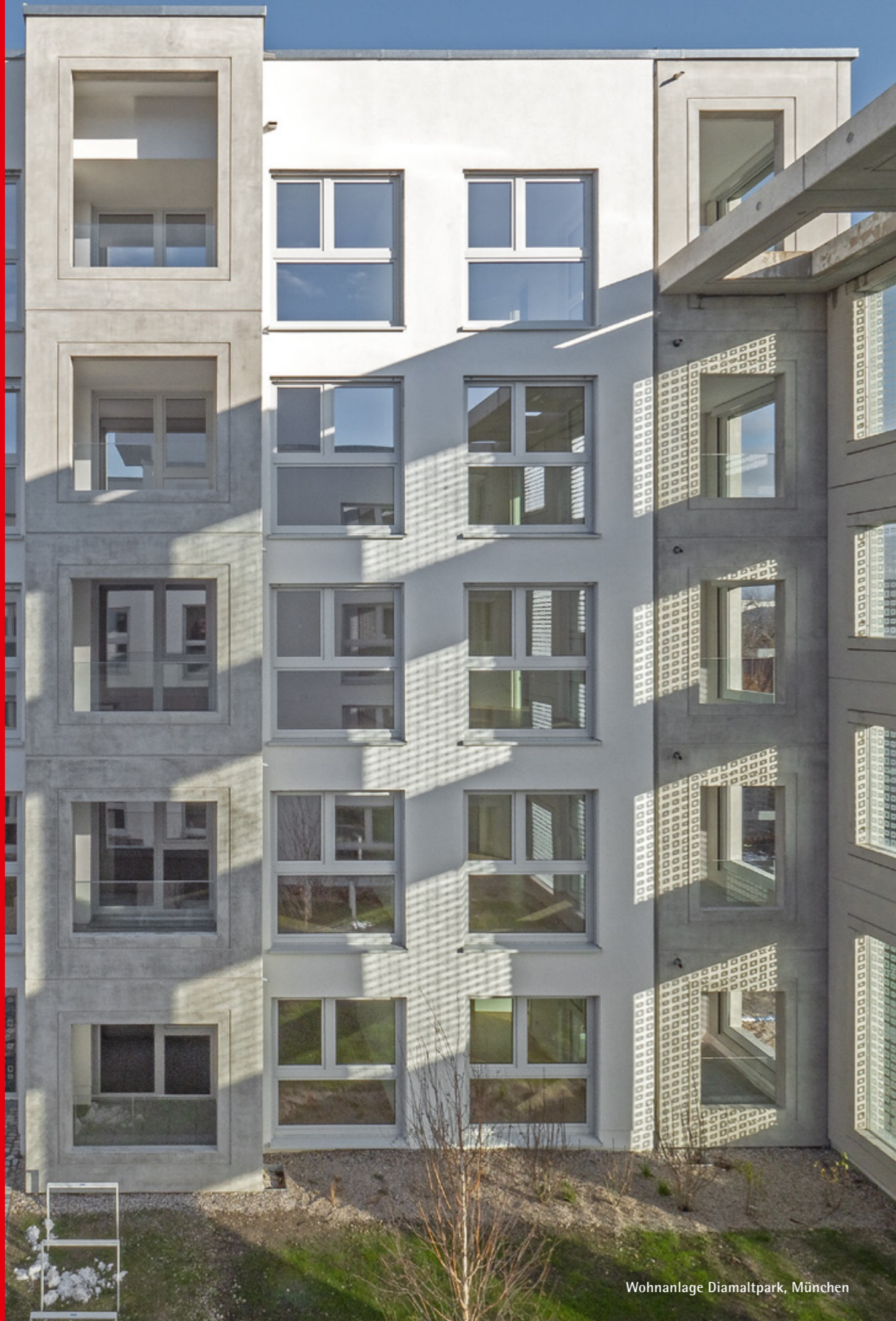
Wohnanlage Diamaltpark, München