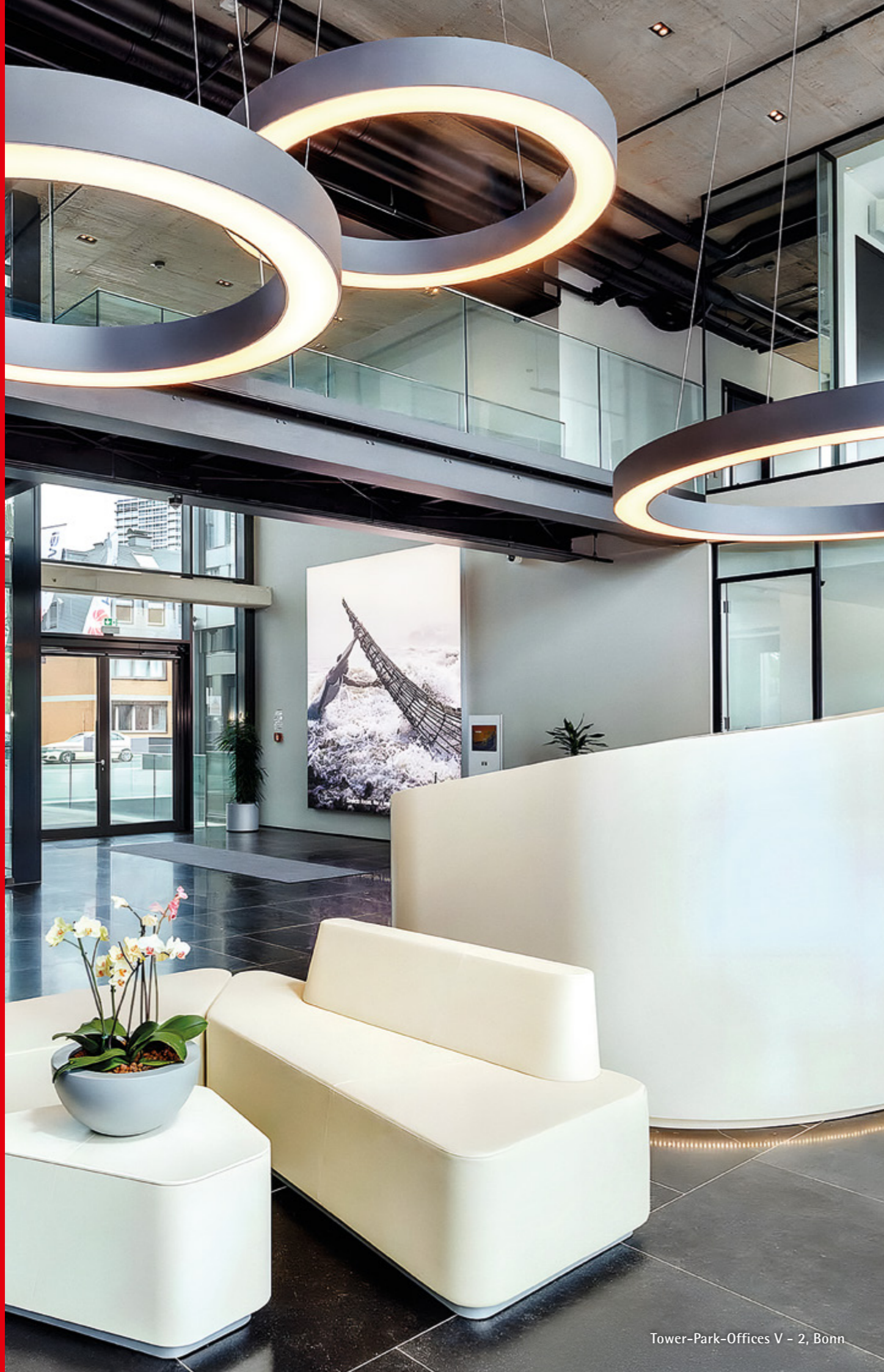
Tower-Park-Offices V - 2, Bonn