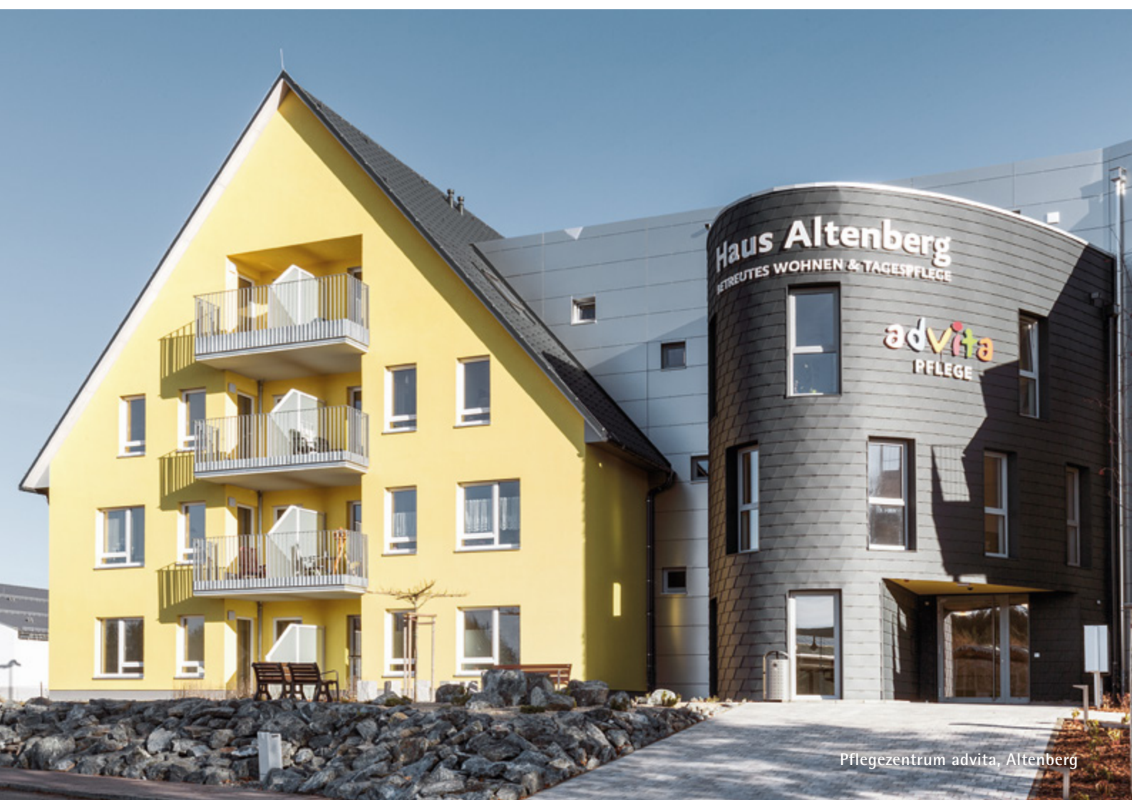
Pflegezentrum advita, Altenberg