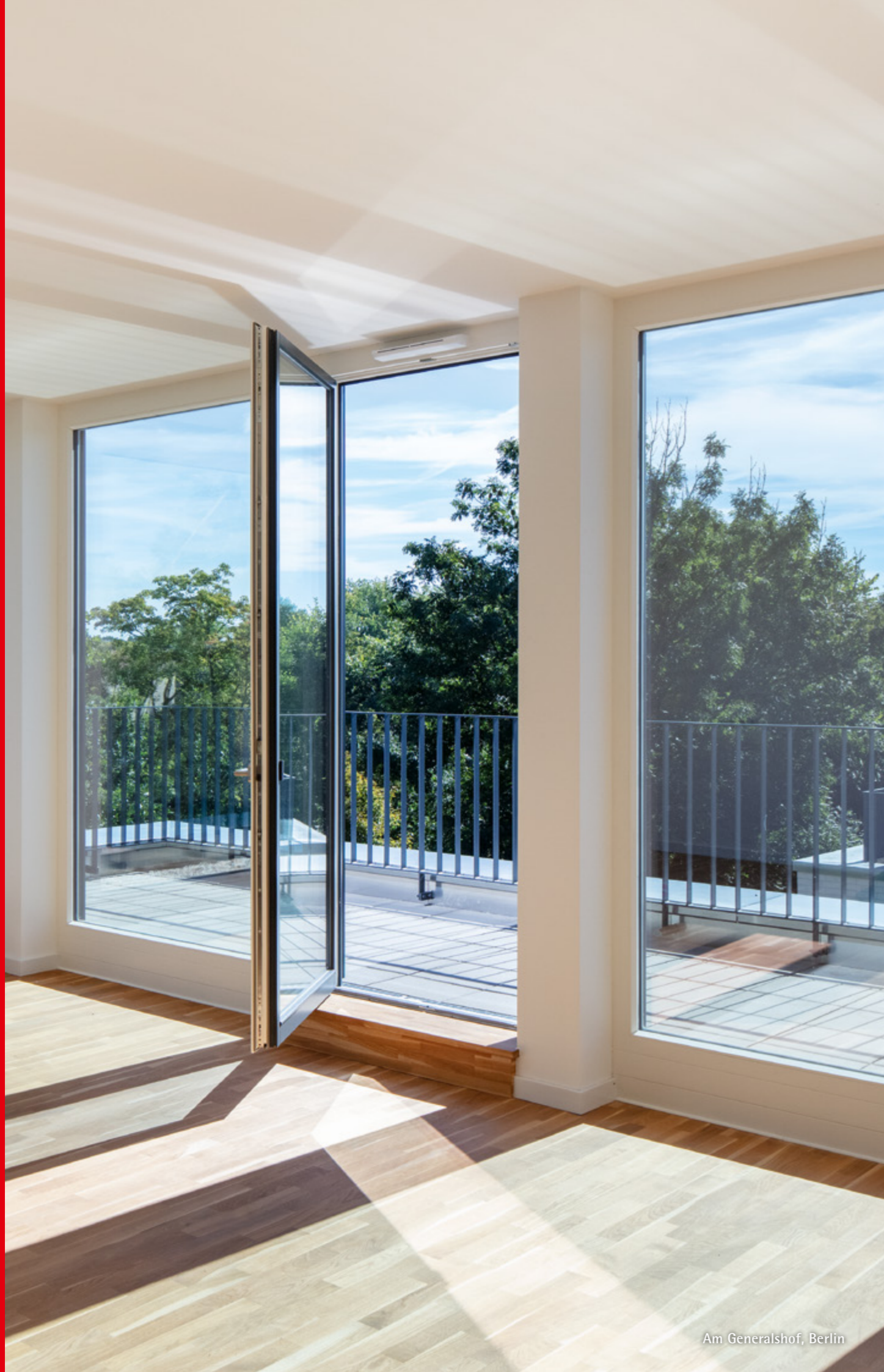
Am Generalshof, Berlin